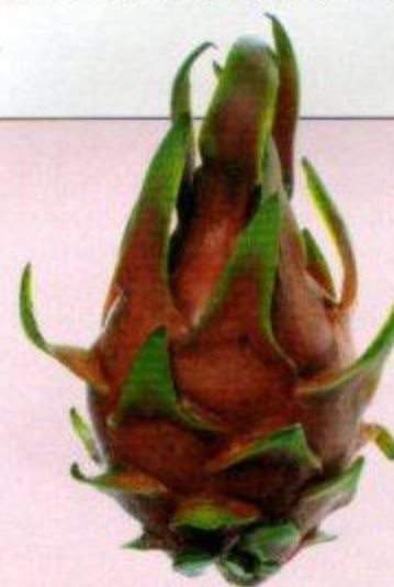
Pitahaya alias dragon fruit

Trapiche Malbec Single Vineyard 2004. Richtprijzen tussen €22 en €25. Importeur Poot, tel. 0174-512 561.